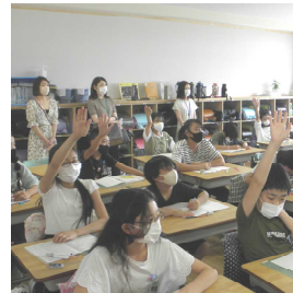
新しい教室で授業